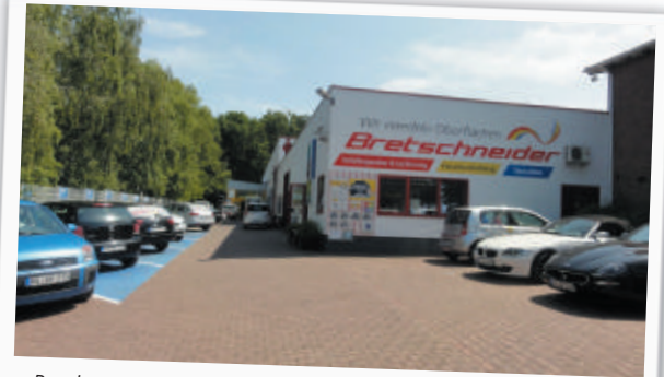
Bereits seit 1989 veredelt die Firma Bretschneider Oberflächen für Industrie und Handwerk, sowie Privatkunden.

Nicht hadern, sondern die Dinge anpacken – das ist das Motto des Betriebsinhabers. Doch er weiß: „Es wäre ein großer Fehler gewesen, wenn ich meinen beiden Kindern von Beginn an eingetrichtert hätte, die Firma übernehmen